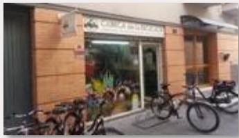
Alquiler de bicicletas Bike rental